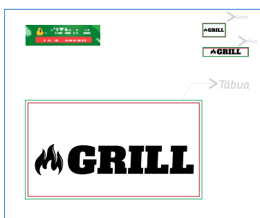
Página 01 Impressão (100%K - Vetorizada)